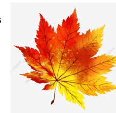
A.Koliņa, 10.b klase