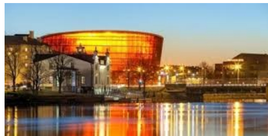
Santa Vaivare, 10.b